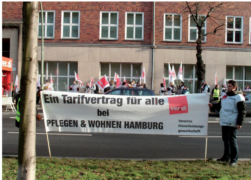
Demonstration der „Wohnen und Pflegen“-KollegInnen in Hamburg

Die Kollegen von „Wohnen und Pflegen“, Hamburgs größter Altenpflegeeinrichtung, sind am 9. Januar in einen unbefristeten Erzwingungsstreik getreten. Ich konnte am nächsten Tag vor den Streikenden auf einer Kundgebung von unserem CFM-Streik berichten. Die Hamburger haben dann am 18. Januar die VITANAS-Zentrale in Reinickendorf besucht, wo sie von ver.di Berlin, Unterstützern und einen Bundestagsabgeordneten der „LINKen“ empfangen wurden.